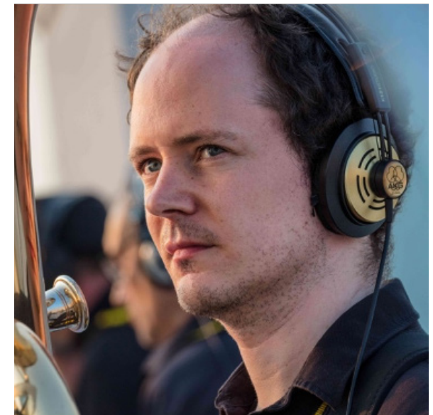
Jack-Adler Mckean Konzeption und Programm Zürich | Berlin