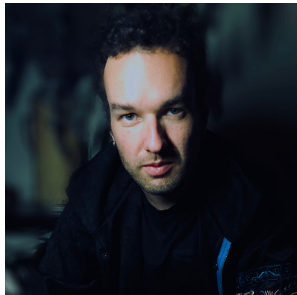
Eugene Birman Konzeption und Komposition Zürich | Hong Kong